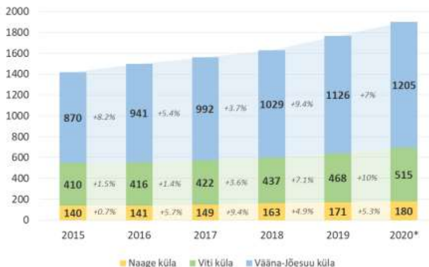
Joonis 2: Vääna-Jõesuu kandi külade elanike arvu dünaamika aastatel 2015 – 2020 1. jaanuari seisuga; *1.märtsi seisuga.

Seisuga 01.03.2020 elas piirkonnas 1900 elanikku.