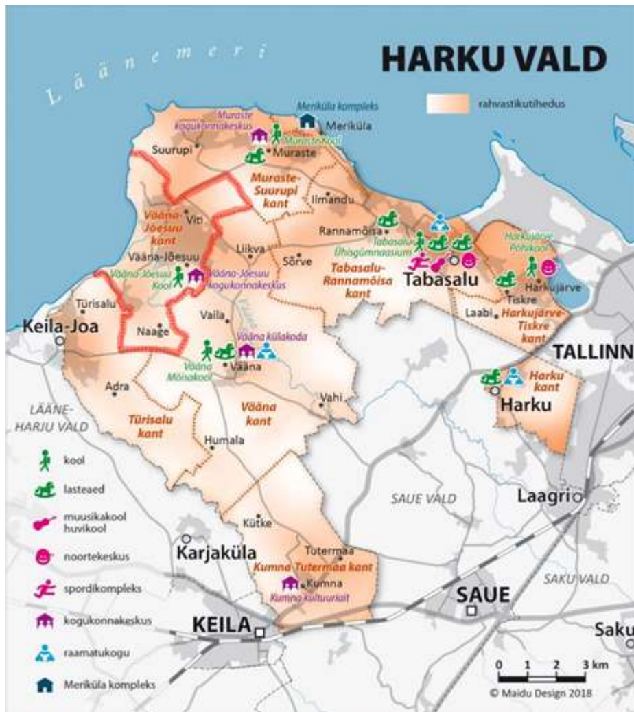
Joonis 1: Harku valla kaart [ https://www.riigiteataja.ee/aktiisila/4101/0201/8028/HarkuVVK_2018_m13_Lisa4.pdf ]

Vääna-Jõesuu külaseltsi tegevuspiirkonnaks on Harku valla lääneosas paiknev Vääna-Jõesuu kant, kuhu kuuluvad Vääna-Jõesuu, Viti ja Naage külad (vt. kaarti). Kandi keskus, Vääna-Jõesuu, asub Tallinna kesklinnast 25km kaugusel kuid võimaldab tänu heale transpordiühendusele piki Tallinn - Rannamõisa – Kloogaranna kõrvalmaanteed (riigi kõrvalmaantee nr 11390 [ https://www.mnt.ee/et/tee/eesti-teeedevork ]) jõuda Tallinna keskusesse 30 minutiga.